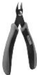
Art. Nr. 170688 Spezial-Seitenschneider zum gratfreien Abtrennen von feinsten Spritzteilen. Nur für Polystyrol geeignet.

Vloeibare lijm in plastic-flacon met doserbuisje om nauwkeurig te lijmen.