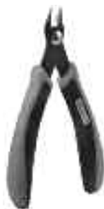
Art. Nr. 170688 Spezial-Seitenschneider zum gratfreien Abtrennen von feinsten Spritzteilen. Nur für Polystyrol geeignet.

Vloeibare lijm in plastic-flacon met doseerbuisje om nauwkeurig te lijmen.